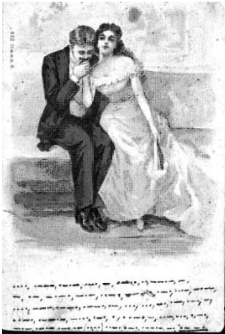
Detta kort skickades till en Fröken S.L i Timmernabben 1904. Vem kan läsa det? I nästa nummer kommer svaret.

På våra egna CD-skivor och böcker tillkommer en avgift på 50 kr för icke medlemmar. De priser som står i detta blad är alltså medlemspriser.