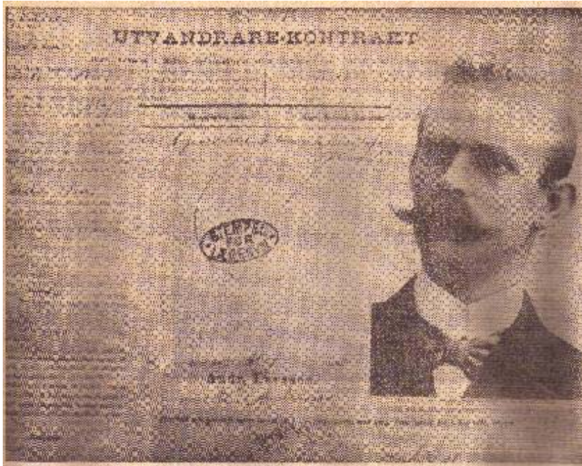
Det här kontraktet hittades i en boktrave, som köptes för 50 öre på en auktion i Nybro

land skulle givetvis heta Flemming i Amerika. Men detta namnbyte satte sig givetvis den förnäma flemmingska släkten emot, så Andersson fick förbli Andersson, även om han for till Amerika på ett rosenrött kontrakt.