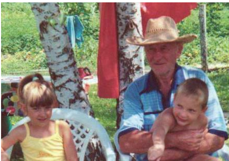
Pappa och barnbarnen