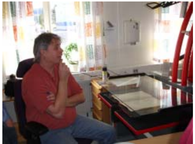
Olika skannrar på MKC, Fränsta

ferens för oss förtroendevalda. Jag hade aldrig varit i Sundsvall tidigare, så själva trakten var en intressant upplevelse. Staden har vuxit fram djupt nere i en dalgång där Ljungan rinner ut i Bottenhavet. Efter lördagens kvällsmåltid uppe på Norra berget invid staden var vi några vänner som tillsammans vandrade neråt till hotellet. Aprilkvällen var kylig och blåsig, men vilken vy med stadens ljus vi hade nedanför oss på vandringen!