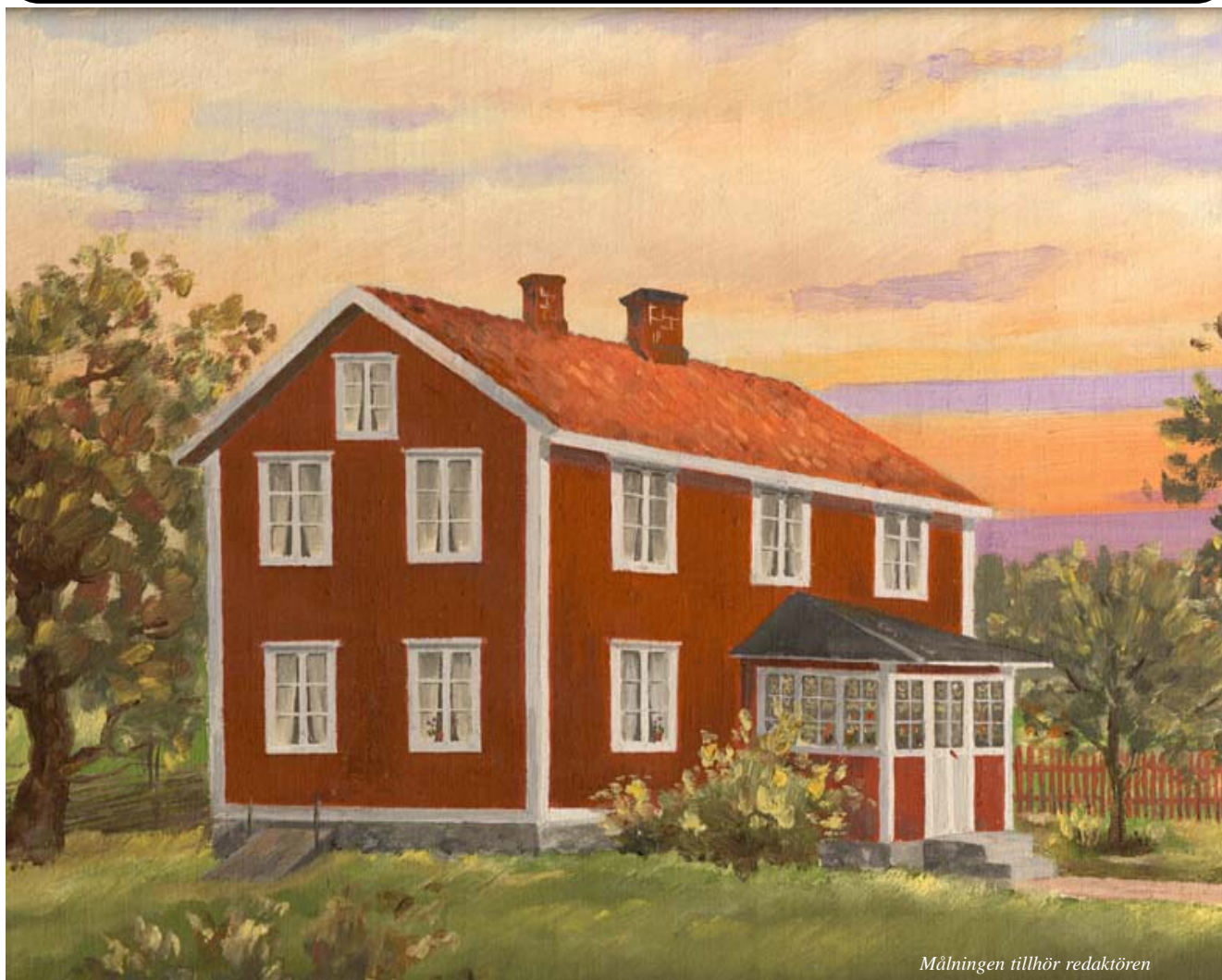
Målningen tillhör redaktören